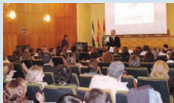
Un momento del ciclo Jueves Salud 2007.