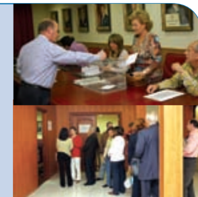
Votaciones. Dos momentos de la elección de delegados en el Colegio de Farmacéuticos de Granada.