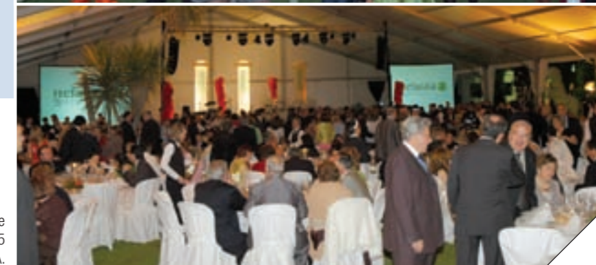
Bajo una enorme carpa se sirvió la cena de gala del 75 aniversario de HEFAGRA.