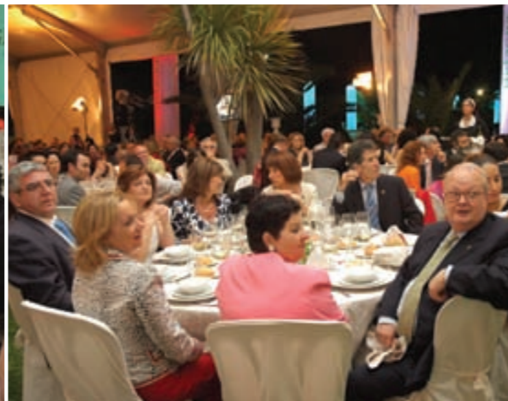
El buen ambiente, como en otras ocasiones, presidió el encuentro de los farmacéuticos.