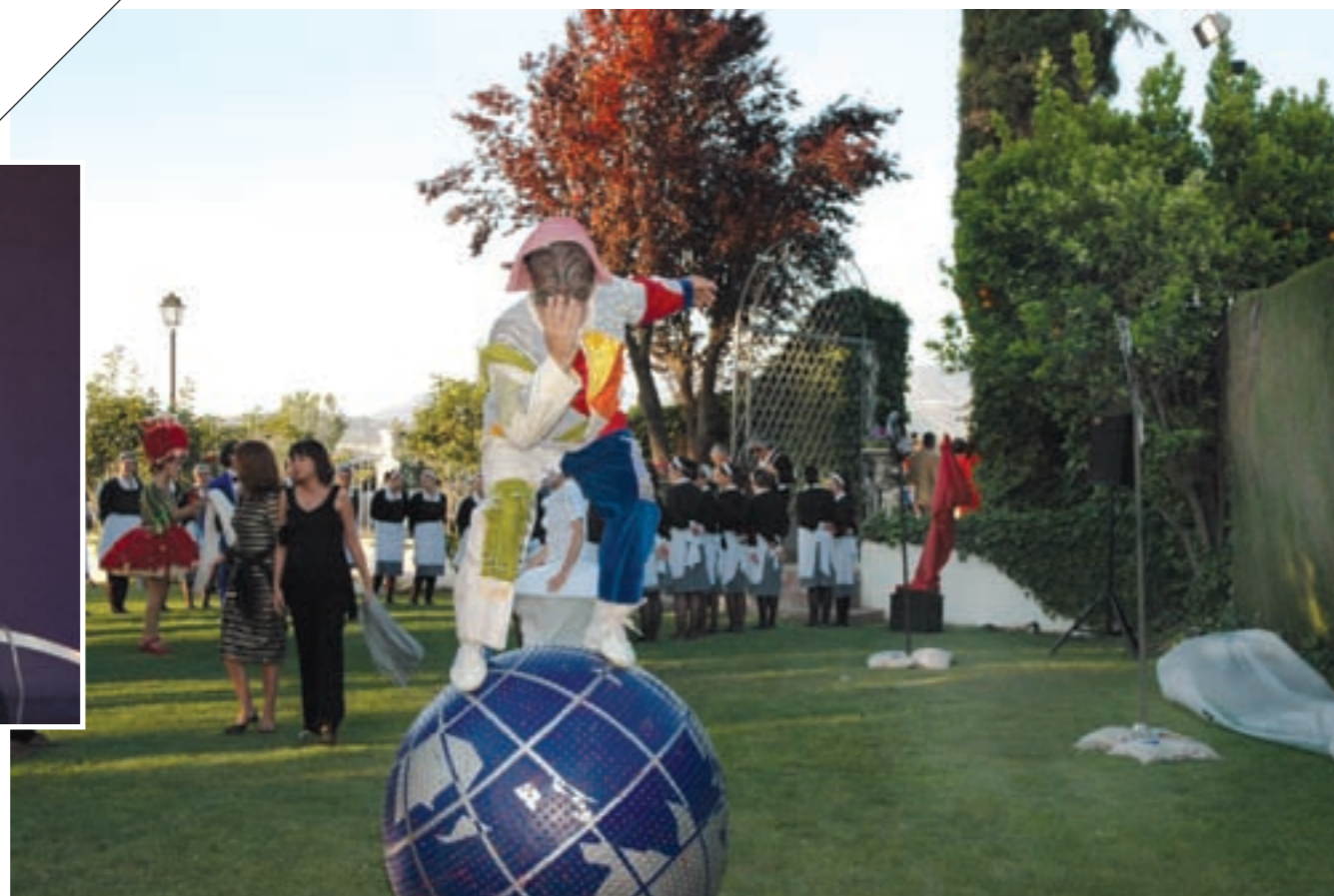
Els Comediants se encargó de amenizar la copa de bienvenida.