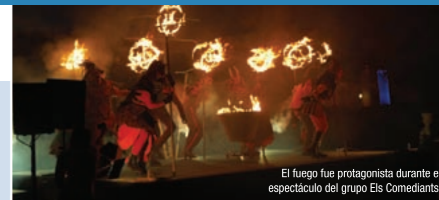
El fuego fue protagonista durante el espectáculo del grupo Els Comediants.