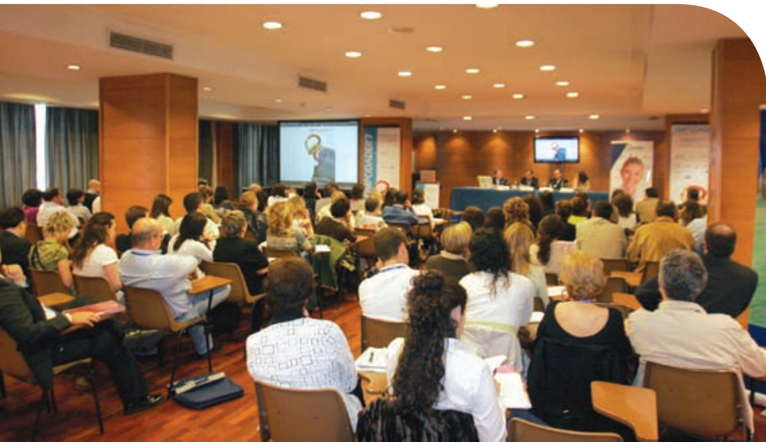
Lleno. Vista general del auditorio en el que se celebró el Simpodáder 2007, que se llenó durante las tres jornadas.

continuada, sistematizada y documentada, en colaboración con el propio paciente y con los demás profesionales del sistema de salud, con el fin de alcanzar resultados concretos que mejoren la calidad de vida del paciente”.