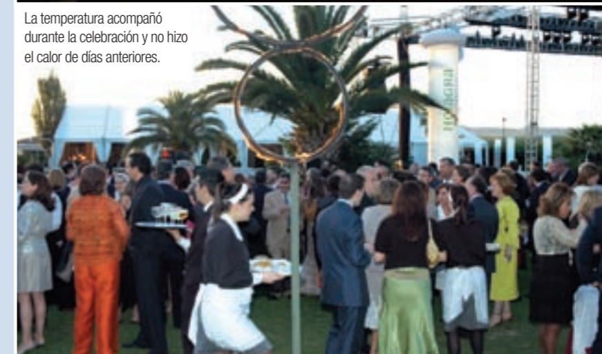
La temperatura acompañó durante la celebración y no hizo el calor de días anteriores.