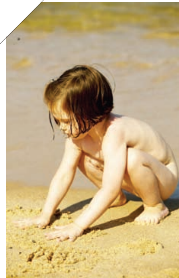
La edad extrema (lactante, niño y persona de edad avanzada) es un factor de riesgo en situaciones de olas de calor.

Algunos medicamentos interactúan con los mecanismos adaptativos del organismo en casos de temperaturas elevadas