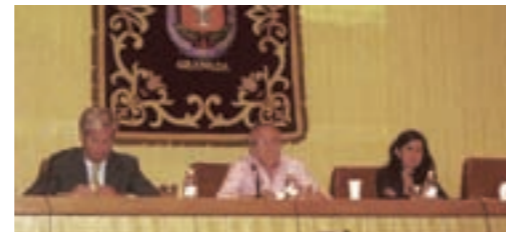
Presentación. Tuvo lugar en el Salón de Actos del Colegio.

La Fundación para la Investigación en Salud, (FUINSA) le ofrece todo el asesoramiento necesario para la realización de la Memoria de Sostenibilidad y la verificación de la misma, para que realizarla no le suponga ningún trabajo añadido. La realización de una Memoria de Sostenibilidad