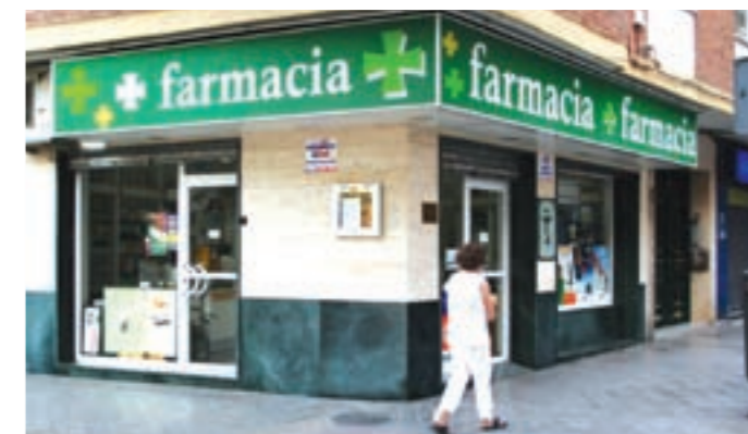
Fachada. La oficina de farmacia está situada en la avenida de Barcelona.