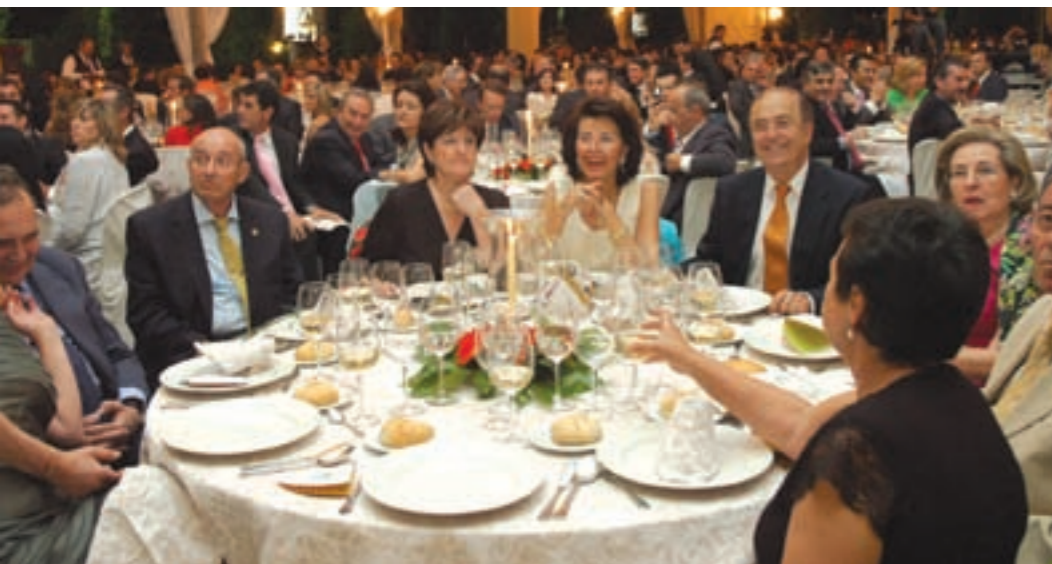
La cena-fiesta se prolongó hasta bien entrada la madrugada.

Ha sido así como, apoyado en su equipo de gerencia, ha desarrollado el proyecto que supone la culminación de setenta y cinco años de esfuerzo y sacrificio. Unas instalaciones que, por su definición, constituyen el referente para las empresas distribuidoras, no sólo a nivel nacional sino internacional, suponiendo al tiempo un activo que sustenta el patrimonio de los socios cooperativistas con garantía de futuro.