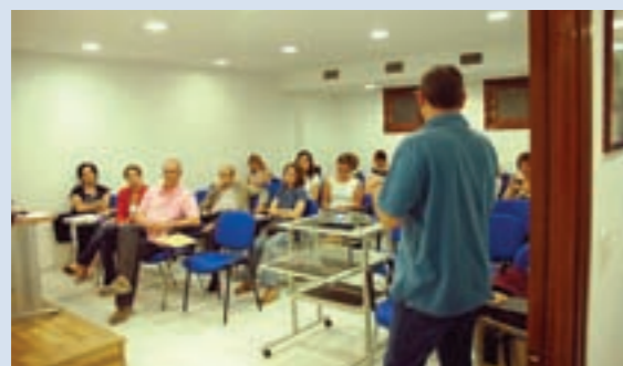
La jornada formativa fue un auténtico éxito.