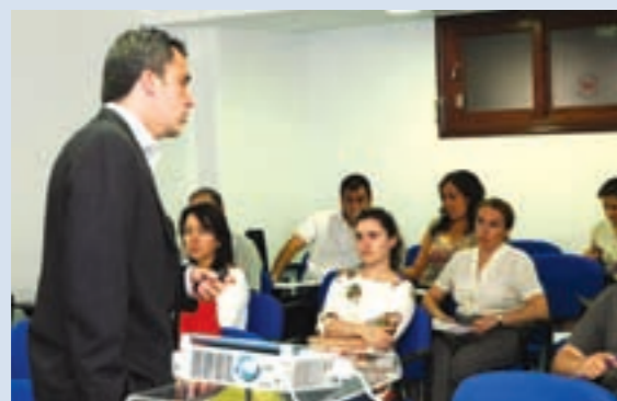
En la imagen, el técnico de CINFA durante la charla.