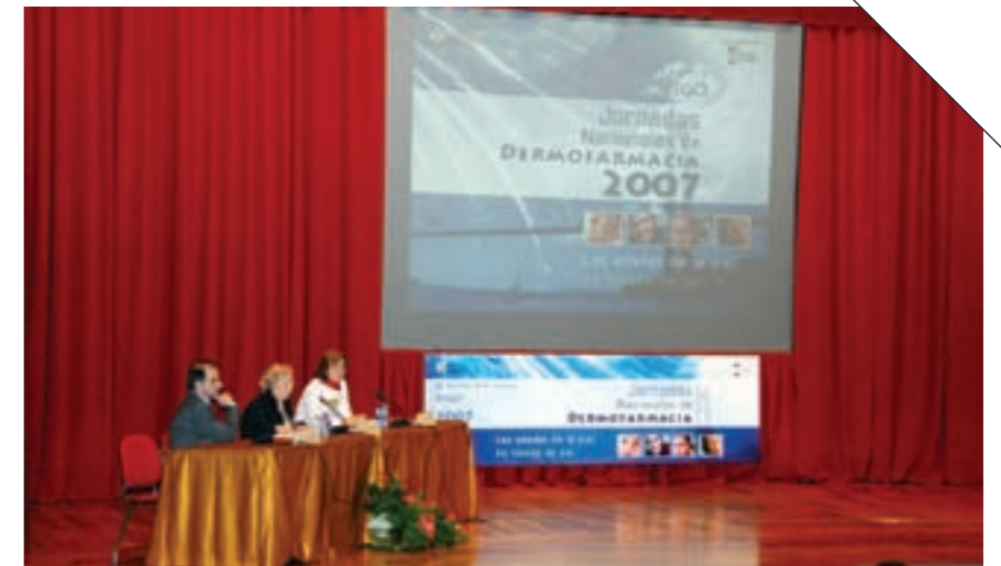
Jornadas Nacionales. Se celebraron en Vigo a finales de mayo y comienzos de junio.